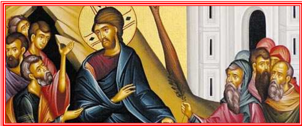
Icona della Festa

Gesù avrebbe potuto evitare di fare il bene, tornare a costruire tavoli, sedie, armadi... e lo avrebbero fatto santo o dottore della legge o dottore della Chiesa. Gesù ha perseverato nel suo disegno e l'impero delle tenebre gli si è scatenato contro. Questo sarà anche per noi, nel nostro piccolo; non saremo ammazzati, ma attraverseremo difficoltà, se vogliamo fare il bene.