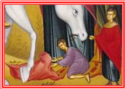
I ragazzi mettono i mantelli e onorano Gesù, come Re.