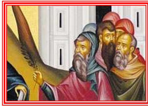
Osanna! Benedetto Colui che viene nel Nome del Signore!