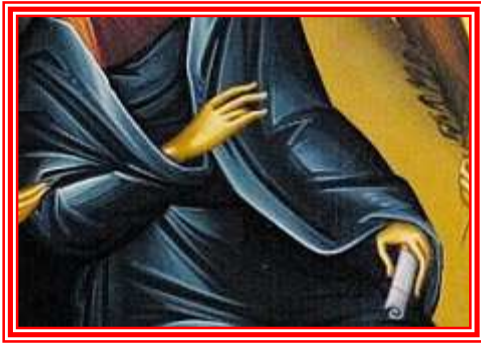
Gesù benedice con la destra e nella sinistra stringe un rotolo