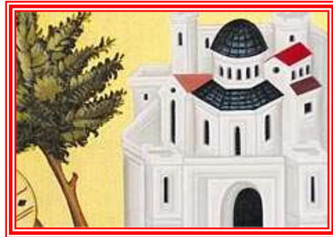
Mura di Gerusalemme